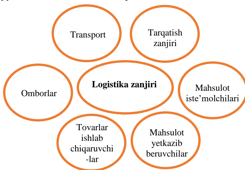
1-rasm Logistika zanjirining bo'g'inlari [2]

Logistika zanjirining har bir bo'g'ini o'z elementlarini o'z ichiga oladi, ular birgalikda logistikaning moddiy asosini tashkil qiladi. Logistikaning moddiy elementlariga quyidagilar kiradi: